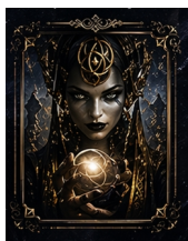
Illustration de couverture :